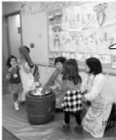
おもちつきをする4歳児