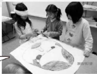
福笑いに挑戦する2年生