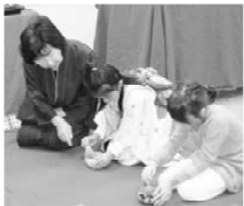
雛祭りお茶会 2年A組お茶を立てているところ

12月2日に行われた日本語能力試験において、高等科上級クラスのボイコット敬来さんが見事難関な「文学・語彙」「読解」において、満点という素晴らしい成績結果が届いた。ボイコットさんの感想は次の通り。