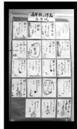
筆ペンで年賀状に挑戦した高等科の作品

小学科においては、スライドショーを見て日本のお正月にちなんだ言葉やお節料理の意味などを学習した。生徒達が手作りしたカルタを持ちより、クラスにてカルタ大会が行われた。また、カタカナ・漢字・ことわざごろくも楽しんだ。