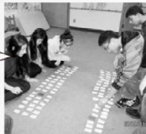
CDを聞きながら百人一首をする高等科

一月いっぱい、普段の学習に加え、日本の伝統的な遊びを楽しみながら、授業を進めていくことにしている。