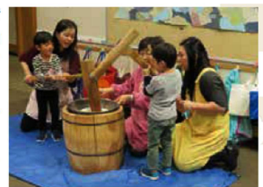
4歳児クラスの餅つき