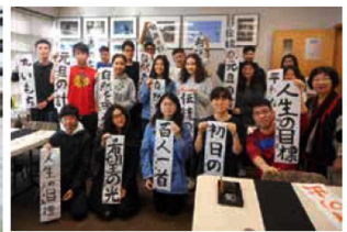
高等学校の書き初め

1月10日に幼稚園科4歳児クラスでは、毎年恒例となる『お餅つき大会』が行われ、きな粉やお醤油でおいしくお餅を頂いた。