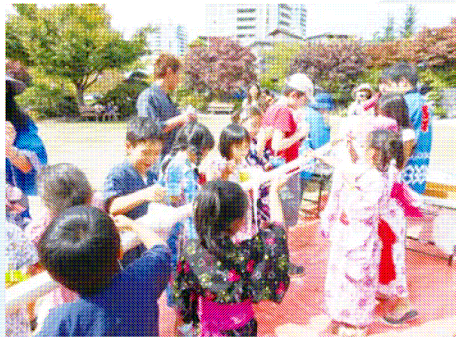
流しそうめんに舌鼓しながら食べる子ども達