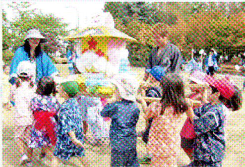
「ワッショイ、ワッショイ」と元氣にお神輿を担ぐ