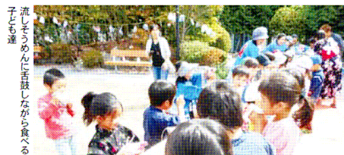
流しそうめんにも舌鼓しながら食べる子ども達