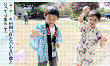
ヨーヨーを回つけたかお互い教えて合つて頑張る二人