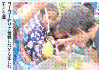
ヨーヨー釣りに苦戦しながら楽しむ子ども達